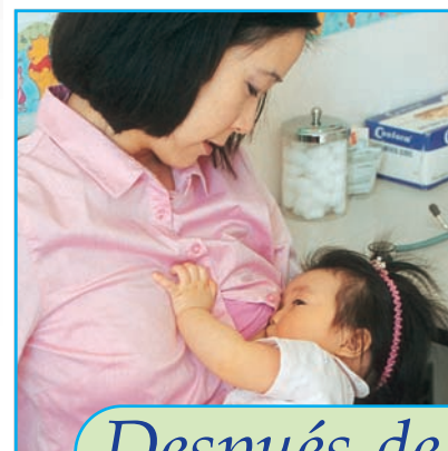
Después de las vacunas: