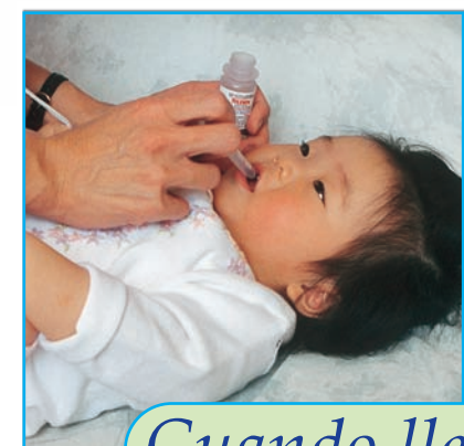
Cuando llegue a casa: