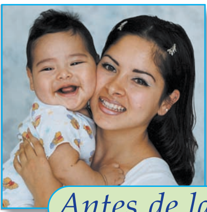
Antes de las vacunas:

Dele amor y cariño a su bebé durante las vacunas.